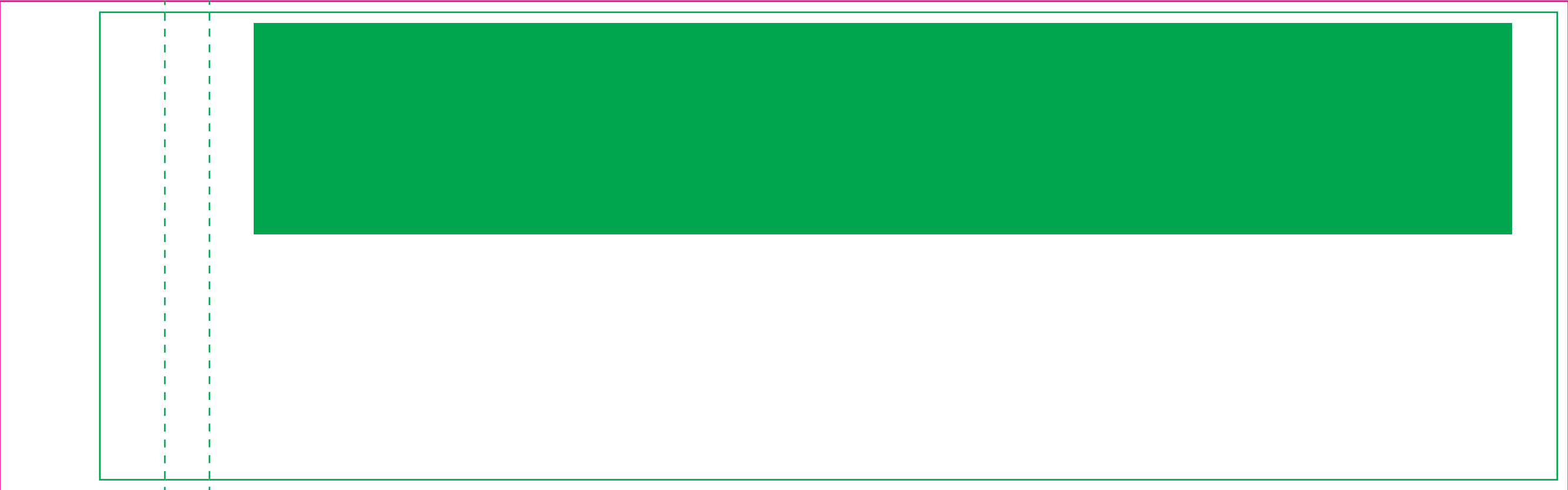
Original Stanze - 1:2: